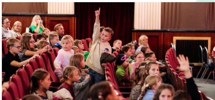
Malé děti nadšeně reagují jak na dotazy před projekcí, tak na situace, které vidí na plátně.